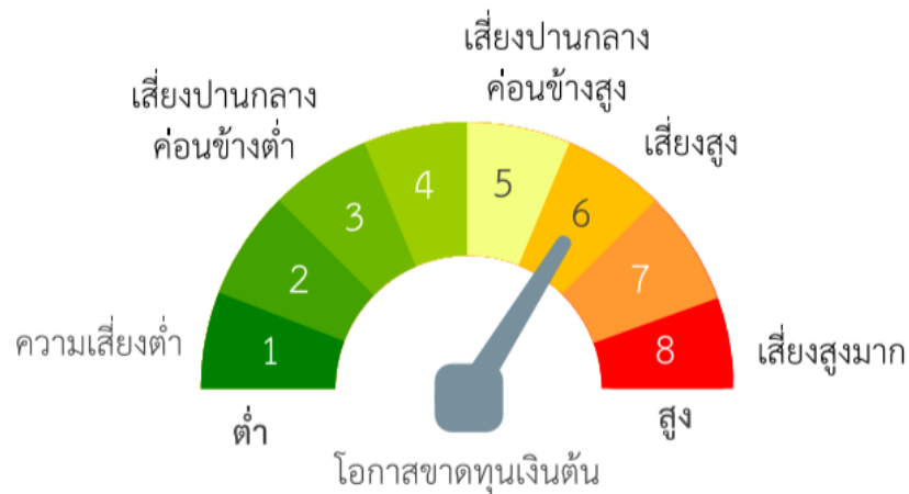
แผนภาพแสดงตำแหน่งความเสี่ยงของนโยบายการลงทุน